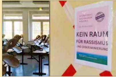
Klare Statements in der Erich-Vieweg-Oberschule

Diese Botschaft wurde sichtbar im Stadtbild verankert. Ein Banner am Gelände des Kinder- und Jugendclubs „Am Bahnhof“, ergänzt durch Sticker und Buttons, macht das Anliegen für alle greifbar. Doch das Projekt blieb nicht bei Symbolen, es lebte vor allem durch Begegnung, Projekte der Fachkräfte und aktive Beteiligung.