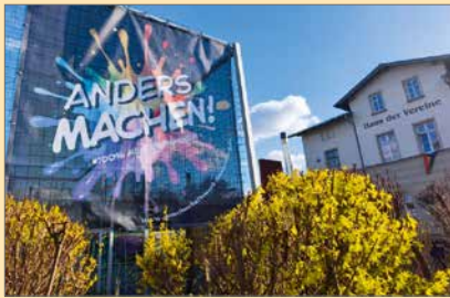
Banner am Haus der Vereine mit dem neuen Logo „Anders machen!“ #100%Menschenwürde

Im Mittelpunkt steht ein eigens entwickeltes Logo, das die Botschaft klar auf den Punkt bringt: keine Diskriminierung, kein Rassismus, Vielfalt und 100% Menschenwürde . Gleichzeitig richtet sich das Statement bewusst gegen überholte Denkweisen, stattdessen geht es darum, Haltung zu zeigen und neue Wege im Umgang miteinander zu gehen.