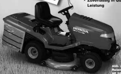
Abb. zeigt Rasenmähertraktoren HF 2622 HT

* Ausstattungsvarianten sind Modellabhängig Unverbindliche Preisempfehlung von Honda Deutschland für den HF 2315 SE