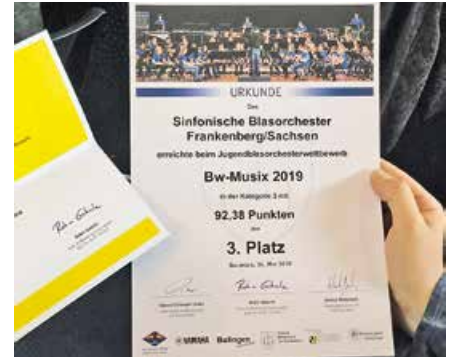
Urkunde für den 3. Platz im Blasorchesterwettbewerb Kat. 3

für die Jugend war das phänomenale Konzert des Heeresmusikkorps Ulm. Balingen steht mit Sicherheit bald mal wieder auf dem Plan.