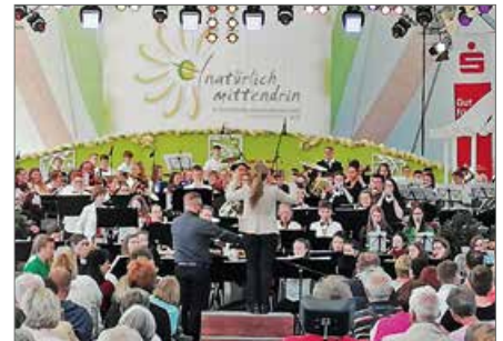
Rendezvous-Konzert mit 300 Musikern auf der Bühne.