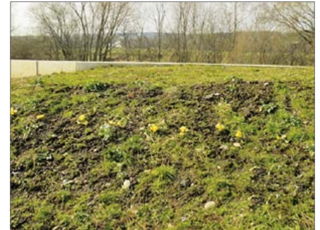
Bepflanzung der Deichböschung mit Frühjahrsblüher, nachhaltige Schädigung als Nahrungsquelle für Wühlmäuse

Im Falle eines Hochwassers ist die Gemeinde für die Gefahrenabwehr zuständig. Verstöße gegen das SächsWG (siehe obige Erklärung) erschweren demzufolge auch die Aufgaben der kommunalen Wasserwehr und bergen zusätzliche Hochwassergefahren.