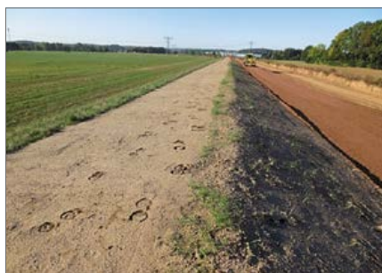
Spuren von Reitaktivitäten auf der Deichkrone, Grasnarbe noch nicht ausgebildet