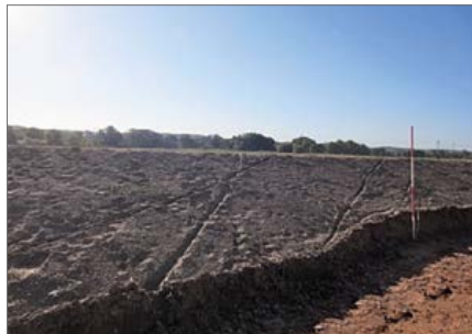
Befahrung des Deiches mit Beeinträchtigung der Geometrie der Ansaatfläche

Eine Verdeutlichung der Sachverhalte finden Sie in diesen Bildern: