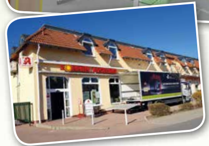
Buntes Familienprogramm mit Ponyreiten und Apothekenführungen!