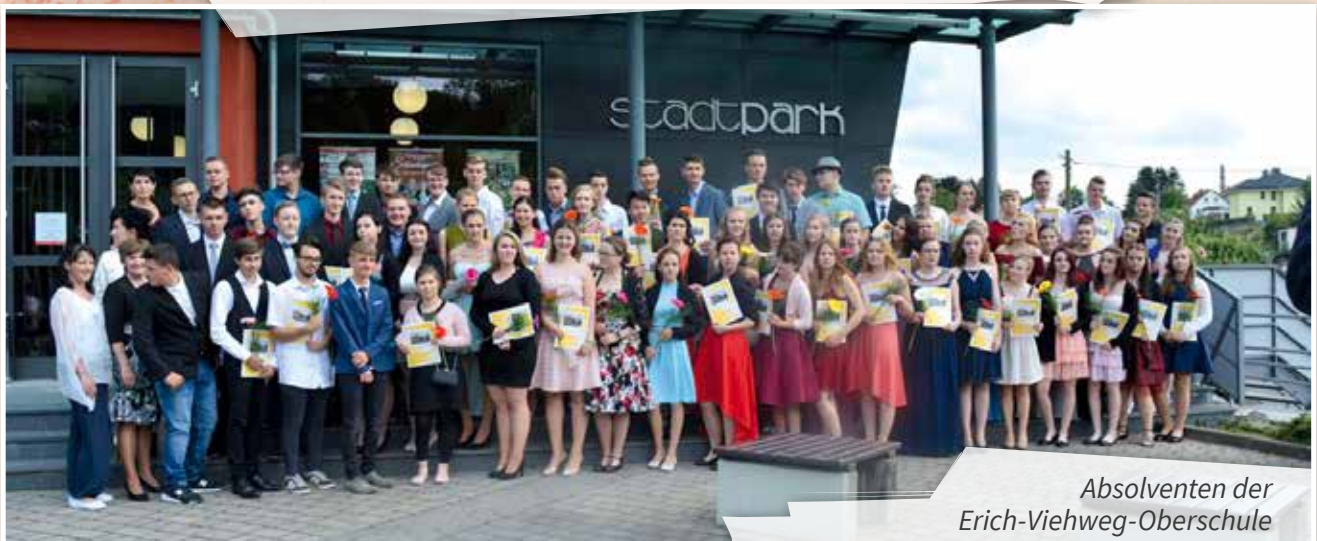
Absolventen der Erich-Viehweg-Oberschule

Unsere Absolventen der Erich-Viehweg-Oberschule und des Martin-Luther-Gymnasiums Frankenberg/Sa. -Jahrgang 2017-