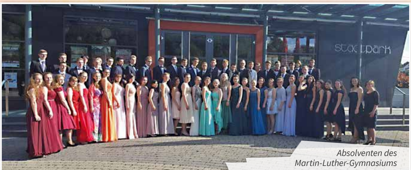
Absolventen des Martin-Luther-Gymnasiums