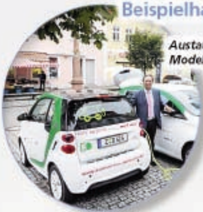
Austausch des „Elektro-Smart fortwo“ durch das neue Modell „Renault ZOE“ Anfang September 2014

„Mit E-Mobil schnell und sauber zum Ziel“ ist das Motto, welches unseren Bürgern die Elektromobilität veranschaulichen soll