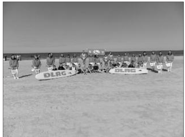
Bild vom IRB mit einem der 2 Rettungsskis der DLRG Sachsenburg im Vordergrund und ein Gruppenfoto der ausgewählten DLRG Delegation und den Mitgliedern des Fanfarenzugs Friedland.